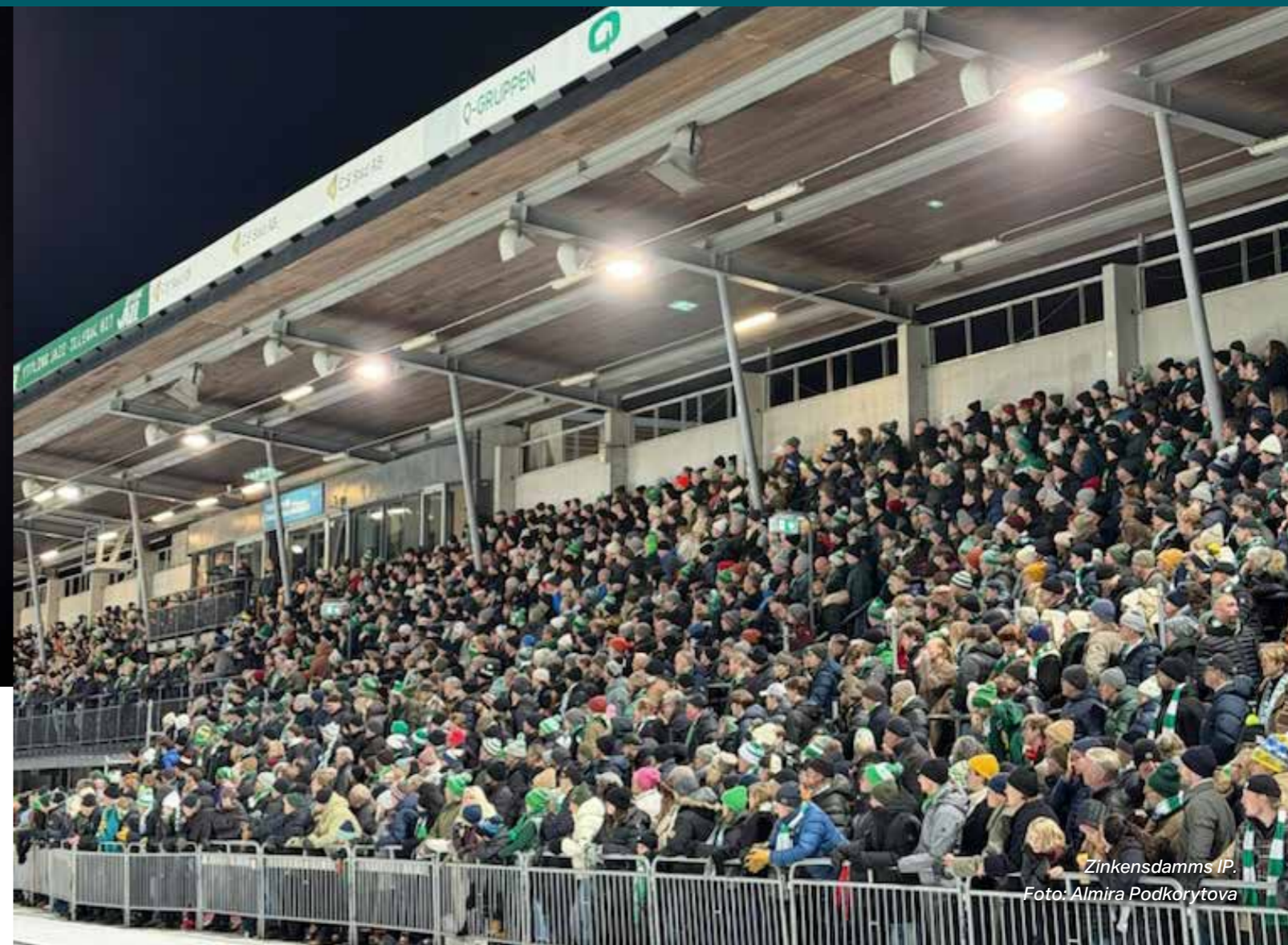
Zinkensdamms IP.

– Inför kommande säsong är ett av mina mål att vara mer närvarande ute hos våra elitserieföreningar och få möjlighet att lära känna dem ännu bättre!